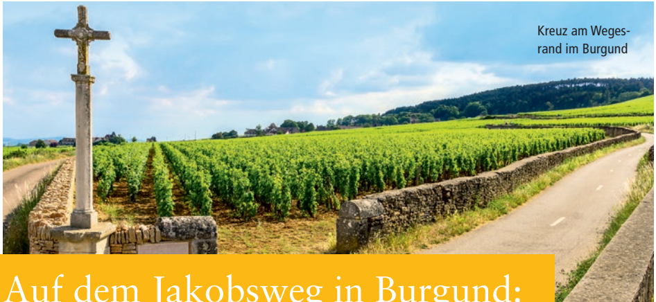
Kreuz am Weges- rand im Burgund